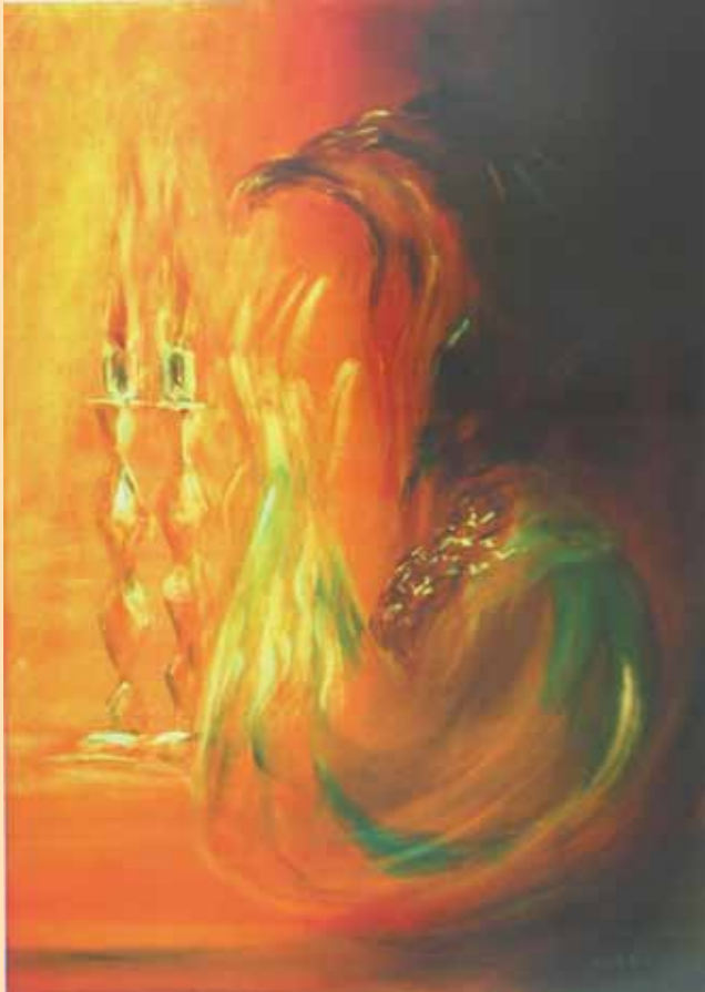
איור: הרב נחום רכל