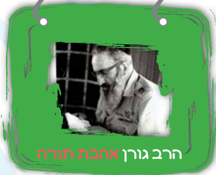
הרב גורן אהבת תורה