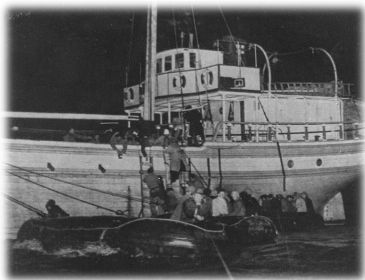
העברת המעפילים בסירות גומי לספינה "לא תפחידונו"