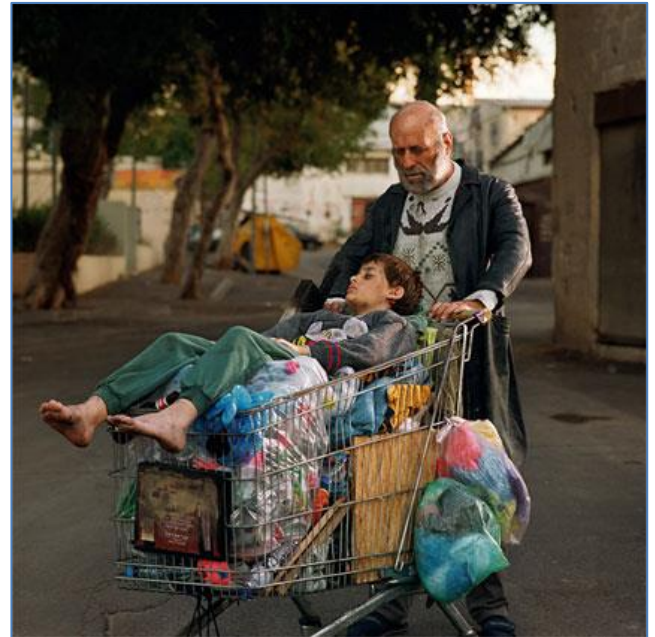
נס, עדי (2008). אברהם ויצחק. צילום סטילס

השילוב בין טקסט ותמונה יוצר טקסט ויזואלי חדש, שפעמים רבות יכול לא רק להגדיר את המרחב מחדש, אלא גם לתת פירוש והסתכלות חדשה לסוגיות עצמם (אוריינות חזותית). דוגמאות לחיבור טקסט תמונה: