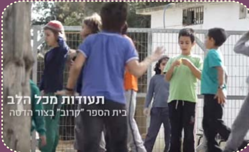
תעודות מכל הלב בית הספר "קרוב" בצור הדסה

הלמידה של התלמיד ועוד). הוא סיים את דבריו בהתרגשות, והניח את התעודה על השולחן. מה צריך לקרות כדי שהתלמיד ייקח את התעודה? מה יש בתעודה שנכון למנף? איזה תהליך יכול לעבור התלמיד, כך שהוא יצפה לתעודה וירגיש בצמיחה? כיצד "נצל" נכון את התעודה, כך שכולם יחכו לקבלה? התעודה היא חלק מסדר היום הבית ספרי, הנוכל לראות בה סימן דרך המחזק את ציר ההתקדמות האישי לכל תלמיד? חשוב לזכור שהתעודה היא כלי בלבד. כתיבת התעודה ונתינת התעודה מקבלות משמעות כאשר התלמיד והמורה רואים בה בסיס לשיחה אישית על התקדמותו של התלמיד, על מצבו האישי, על מצוקותיו, על לבטיו ועל חלומותיו. אם המורה זוכר שלא הציון הוא העיקר, אלא עמל התורה שהשקיע התלמיד - אז התלמיד נפגש באור ולא רק בגורם אינסטרומנטלי, בכלי. אם התעודה היא בסיס לצמיחה, לרצון לחלום, להתקדם ולראות את האופק הטוב, אז רגע קבלת התעודה והמפגש האישי בין המורה והתלמיד, יש בהם אור ומקור לגעגוע.